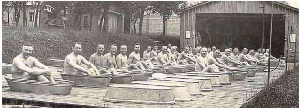
Wanne an Wanne, streng nach Geschlechtern unterteilt: Welchen Namen hatte diese Diezer Einrichtung?