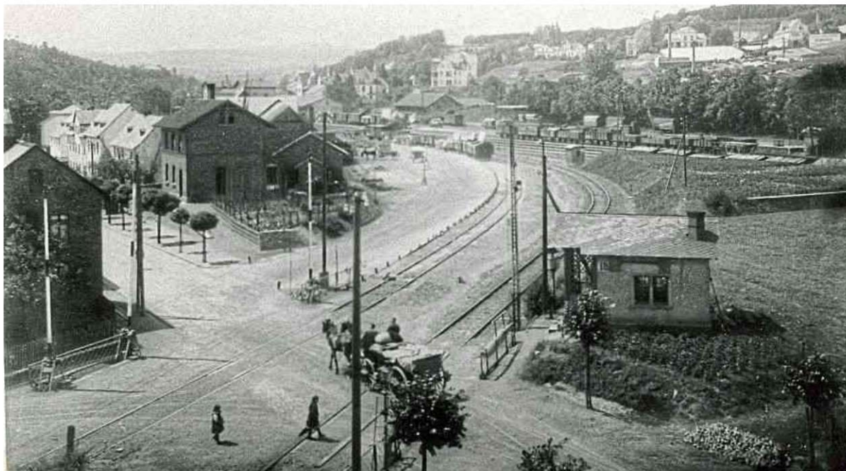
Die Aufnahme zeigt den Bahnübergang im Ortsteil Freindiez und stammt etwa aus dem Jahr 1920.

Nach Abschluss des Quiz wird die richtige Antwort auf der Homepage des Lions Club Diez veröffentlicht. Die Gutscheine können bis zu drei Wochen nach Gewinnbenachrichtigung unter Vorlage des Personalausweises in der Volksbank Rhein-Lahn-Limburg, Ernst-Scheuern-Platz 1, 65582 Diez abgeholt werden. red